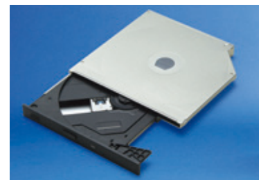
PC用ドライブケース