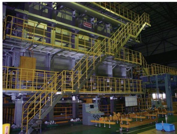
図2 2号焼入炉 Fig.2 No.2 quenching furnace.