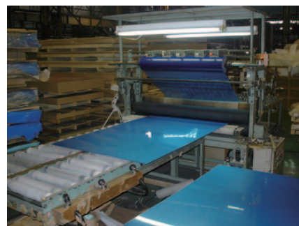
シートマスクング機